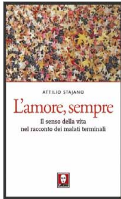
La soracuerta del liber.

“I malé en fin de vita ne sporc, eneben soe condizion, n ejempie e n model: l progressif destacament da dut chel che te soa vita era al zenter de soe atività e cruzies. I se